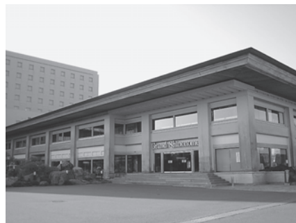
ホテルグランド東雲

その調子が人気を呼び、江戸時代の代表的売薬となった。兵助の大道での演技はさらに脚色され磨かれ、大道舞台芸能として民俗文化面での評価も高まり、現在は民俗大道芸能として第十九代永井兵助が正調ガマ口上を伝承している。